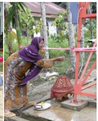
もち米を井戸にくっつけるなど、伝統的な儀式