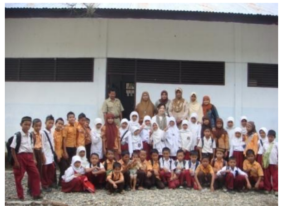
モンパソン小学校の子ども達 グッドネーバーズ・ジャパンが支援する子ども達もここに通っています。

今回、日本の皆様のご寄付のおかげで、モンパソン村の住民が安全な水を手に入れることができるようになりました。この井戸が、下痢や水因性の伝染病などから子ども達を守り、健康的な成長を助けることができるよう、グッドネーバーズは今後もこの地域で支援活動を続けていきます。