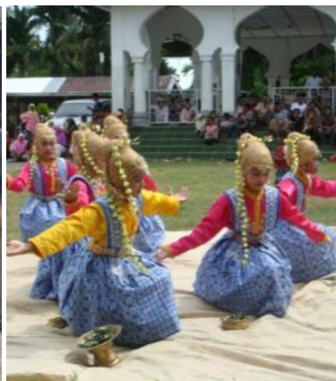
伝統の踊りを披露する少女達