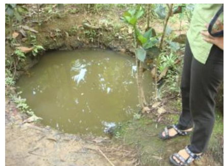
訪問した家庭のため池。 この水を洗濯、水浴び、料理、飲み水などに使用していました。

モンパソン村の今までの水の入手方法は、比較的余裕のある家は、バイクで飲み水を買に行くこともあります。約90%の家庭はため池の水を生活用水としてだけでなく、沸かして飲用としても使っていました。ため池の水は、茶色く濁っており、とても飲めるようなものではありません。