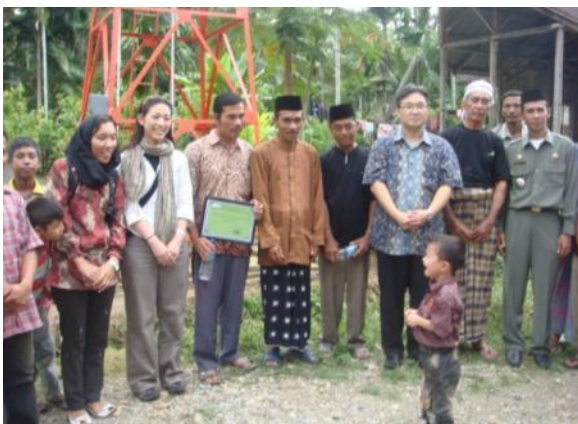
“Dusun”と呼ばれる3つの自治区の長達と、さらにその上の District の長も出席し 400 人以上が出席