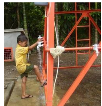
お祈りの前に体を洗う子ども