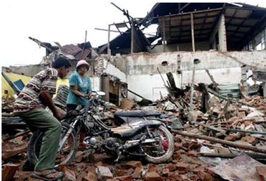
建物が崩れ、数千人が瓦礫の下に埋まった。

土砂崩れや建物の崩壊により生き埋めなるなど、1100人を超える人々が亡くなり、道路状況も悪く救援作業は難航。病院もパンク状態で、猛暑の中多くの人が家族や家を失った苦しみの中にいます。