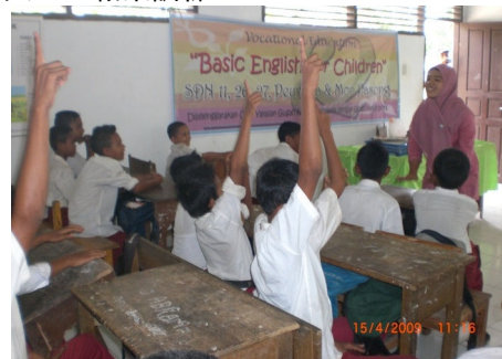
「はい！」日本とは手の上げ方が違います。